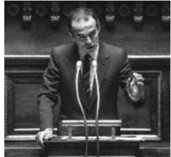
A la tribune de l'Assemblée Nationale en 1981 pour défendre l'abolition de la peine de mort.

Ce sont ces questions auxquelles tentent de répondre ces extraits de films, avec comme parti pris de n'évoquer que des crimes entraînant la mort des victimes. Le second parti pris pose la manière de représenter les crimes selon certains choix esthétiques et selon la recherche d'effets sur le spectateur.